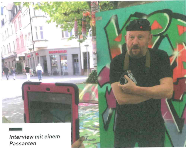
Interview mit einem Passanten