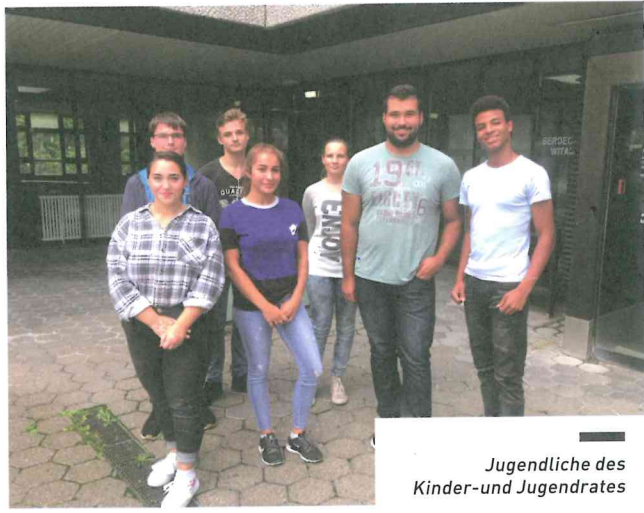
Jugendliche des Kinder- und Jugendrates

im Rahmen eines kleinen Schulfestes dem Bürgermeister und vielen Gästen in der Schule präsentiert. Zwei weitere Schulen, darunter eine Gesamtschule, führen das Projekt im Herbst 2018 durch. Die Offenen Ganztagschulen haben außerdem die Möglichkeit, das Team #stadtsache an zwei aufeinanderfolgenden Tagen anzufordern, um den Quartiersraum zu untersuchen.