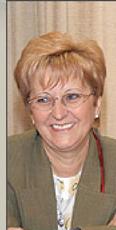
Judit Csabai, Bürgermeister, Stadt Nyíregyháza