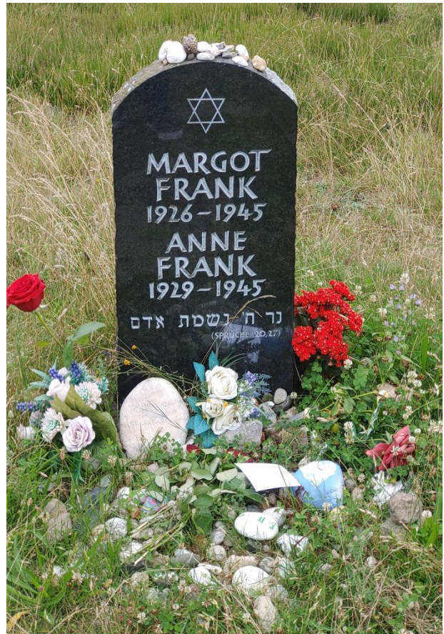
Aus: Handreichung zum Anne Frank Projekt Iserlohn „Anne Frank und jüdisches Leben in Iserlohn“, Stadt Iserlohn, 2019 (Bild Anne Frank). Abt. Jugendarbeit (Jugendschutz) der Stadt Iserlohn, Juli 2021 (Foto vom Gedenkstein von Margot und Anne Frank in Bergen Belsen).